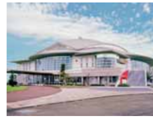
▲串良平和アリーナ