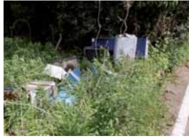
▲不法投棄されたごみ