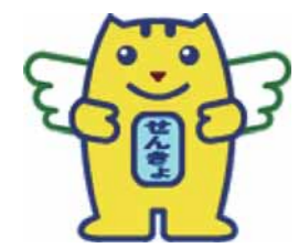
「明るい選挙」推進キャラクター「選挙のめいすいくん」

住所・電話番号を記入のうえ郵送又はFAX リナシティかのや情報プラザ 〒893-0009 鹿屋市大手町1-1 0994-35-1002 0994-43-0744 作品規格 描画材料は自由、サイズは四つ切り(542mm×382mm)、八つ切り(382mm×271mm)、又はそれに準じる大きさ 対象 小学生～高校生 応募方法 各学校に直接提出 応募期限 9月9日(金) ※応募作品は、原則として返却不可 ※入賞作品の著作権は主催者に帰属 開市選挙管理委員会事務局(5階) 0994-31-1142