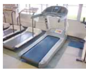
▲新しく購入したランニングマシン