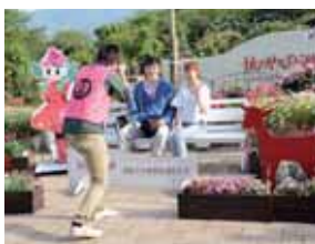
▲シャッター押します隊