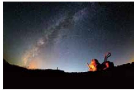
▲第2回グランプリ作品「天の川銀河」

◎テーマ 星空と鹿屋の風景、又は市内から見た星空と景色が一緒に撮影されたもの ◎募集部門 ◎星景写真部門 ◎スマホチャレンジ部門(市内で夕日や朝日を撮影したもの) ◎作品規格 A4、四つ切り又はワイド四つ切り ※組写真、画像処理も可 ※1人何点でも応募可能 ◎応募方法 ◎星景写真部門 ◎ホームページ (http://www.khokuwaba.jp) 又は輝北うわば公園、輝北天球館、市