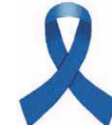
▲北朝鮮日本人拉致被害者救出活動のシンボルマーク「ブルーリボン」

12月10日(土)から16日(金)までは、「北朝鮮人権侵害問題啓発週間」です。 これは、北朝鮮当局による人権侵害問題に関する国民の認識を深めることを目的に、平成18年6月に施行された「拉致問題その他北朝鮮当局による人権侵害問題への対処に関する法律」によって制定されました。 これを機会に、北朝鮮当局による拉致などの人権侵害問題に対する認識を深めましょう。 ◎鹿屋島地方務局鹿屋支局 ☎099-443-6790