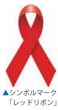
シンボルマーク「レッドリボン」

県では、12月1日(木)の「世界エイズデー」を中心に、12月15日(木)までを「鹿児島レッドリボン月間」と定めています。期間中は、エイズに関する正しい知識の普及啓発を実施することにより、エイズの予防及び感染者・患者などが尊厳をもって暮らせる社会づくりを推進します。 また休日及び平日夜間にHIV検査を実施することにより、感染者・患者の早期発見に努めることとしています。 県の保健所では、原則無料・匿名でHIV検査を受けることができます。HIVの感染は、血液検査によって分かります。大切なパートナーと自分自身を守るために、HIV検査を受けてみましょう。