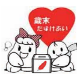
共同募金シンボルキャラクター「愛ちゃんと希望君」

12月1日(木)から31日(土)まで、全国一斉に「歳末たすけあい募金」を行ないます。 歳末たすけあい募金の目的は、新たな年を迎える時期に支援を必要としている人が、安心して暮らすことができるようにすることです。一人ひとりの優しい気持ちで、まちなぎを応援しています。皆さんのご協力をお願いします。