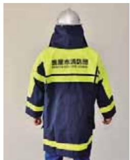
整備した防火衣一式

市では、平成28年度石油貯蔵施設立地対策等交付金事業を活用し、鹿屋市消防団員の「防火衣」などを整備しました。 これは、志布志国家石油備蓄基地周辺の地域における住民の福祉の向上を図るために必要なものを整備する事業です。