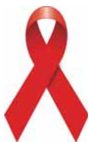
▲シンボルマーク「レッドリボン」