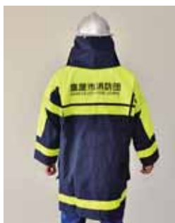
▲整備した防火衣一式