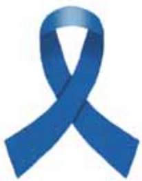
▲北朝鮮日本人拉致被害者救出活動のシンボルマーク「ブルーリボン」