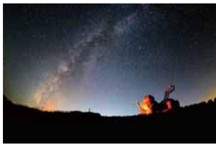
▲第2回グランプリ作品「天の川銀河」

◎問 まちづくり輝北 099-1851-1 鹿屋市輝北町市成16603 099-1485-1818