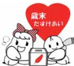
▲共同募金シンボルキャラクター「愛ちゃんと希望君」