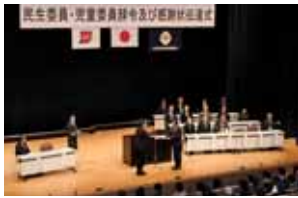
12月2日にリナシ ティかのやで行わ れた辞令伝達式