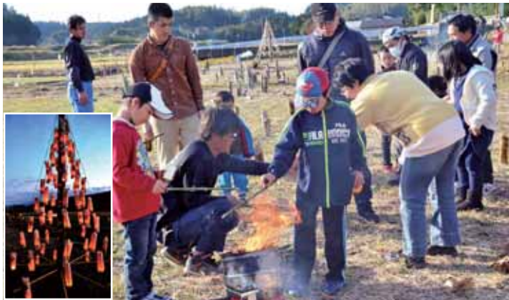
子どもたちに種火を配る「にいま隊」のメンバー