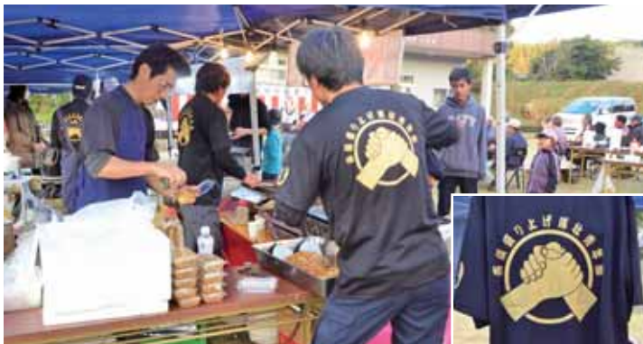
祭りはすべてメンバーが切り盛り。運営はもちろん、司会も出店も駐車場も、そろいのTシャツを着たメンバーが動く