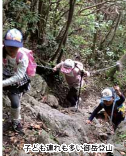
子ども連れも多い御岳登山