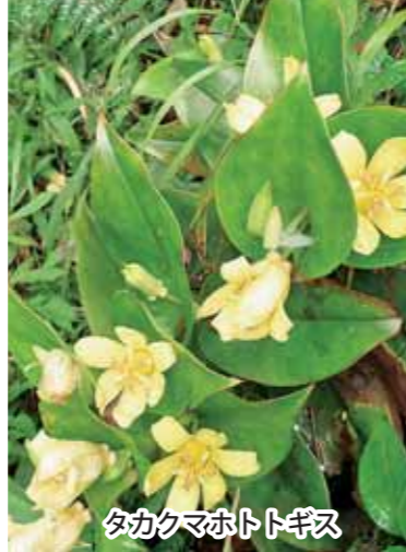
タカクマホトトギス