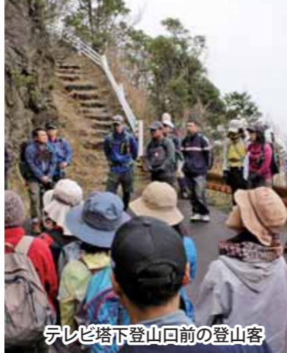
テレビ塔下登山回前の登山客