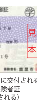
▲修学で転出する人に交付される国民健康保険被保険者証(右上に◎と印刷される)