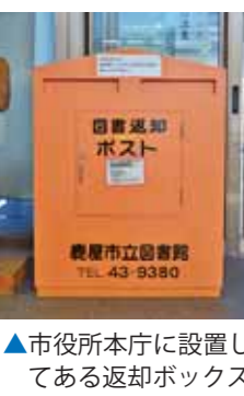
▲市役所本庁に設置してある返却ボックス