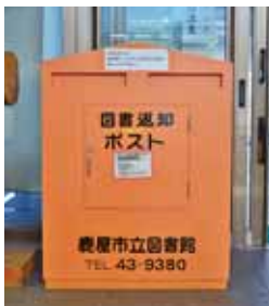
▲市役所本庁に設置してある返却ボックス