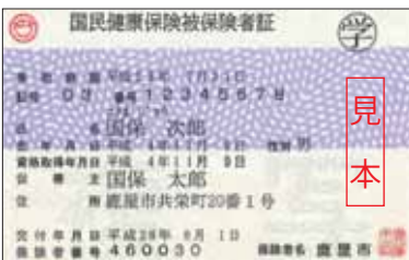
▲修学で転出する人に交付される国民健康保険被保険者証(右上に◎と印刷される)