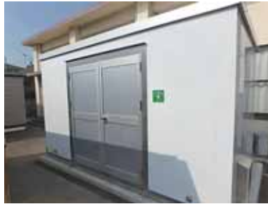
▲今年度整備した防災倉庫