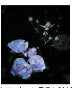
▲フォトコンテスト2016「ばらの部」グランプリ「舞い姫」

鹿屋市共栄町20-1 鹿屋市政策課公園管理室(4階) ☎ 0994-311150