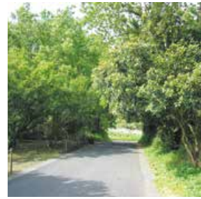
▲道路への樹木の張り出し

任を問われる場合があります。土地所有者は樹木の伐採や枝払い、設置物の撤去を行う等、速やかな対応をお願いします。