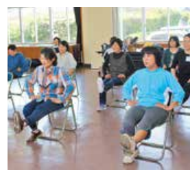
▲ポイント対象教室(かのやん体操)