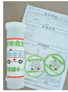
▲救急医療情報キット