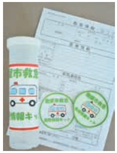
▲救急医療情報キット