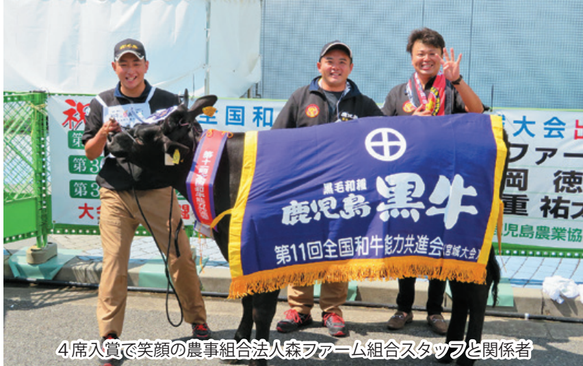
4席入賞で笑顔の農事組合法人森ファーム組合スタッフと関係者

3年前から共進会への取り組みを行っている農事組合法人森ファーム組合は、県の共進会初出品で全共の出場権を獲得。今回の全共では見事4席となりました。