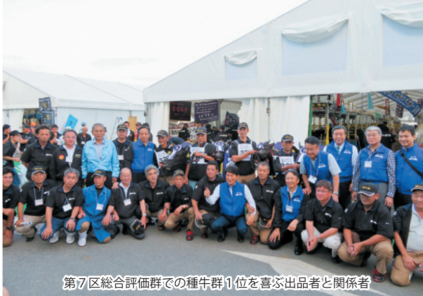
第7区総合評価群での種牛群1位を喜ぶ出品者と関係者

種牛群の県代表牛は肝属和牛育種組合の4頭で、うち3頭が鹿屋市の牛。種牛群の審査では宮崎県を破り1位を獲得しました。肉牛群県代表牛との総合点では5席となりました。