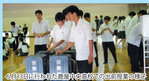
6月13日に行われた鹿屋中央高校での出前授業の様子

平成28年6月から選挙権年齢が18歳以上に引き下げられたことから、現役高校生でも18歳で選挙権を得られます。鹿屋青年会議所では、市選挙管理委員会とタイアップし、市内高校生を対象に、選挙意識向上のための出前授業を行っています。