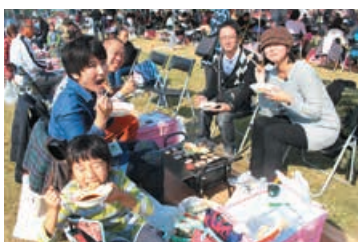
▲昨年の肉焼まつりの様子