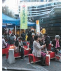
▲100円でお茶菓子が楽しめる「百円茶屋」