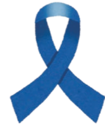
▲北朝鮮日本人拉致被害者救出のシンボル「ブルーリボン」

12月10日(日)から16日(土)までは「北朝鮮人権侵害問題啓発週間」です。 これは、北朝鮮当局による人権侵害問題に関する国民の認識を深めることを目的に、平成18年6月に施行された「拉致問題その他北朝鮮当局による人権侵害問題への対処に関する法律」によって定められました。 これを機会に、北朝鮮当局による拉致などの人権侵害問題に対する認識を深めましょう。 鹿兒島地方事務局鹿屋支局 ☎0994-43-6790