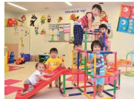
▲増収分の地方消費税を財源として運営される「つどいの広場」

平成28年度の地方消費税交付金のうち引上げ分の7億3,511万円については、子ども医療費助成や地域子ども子育て支援事業など子育てに関する事業の財源の一部として活用しています。