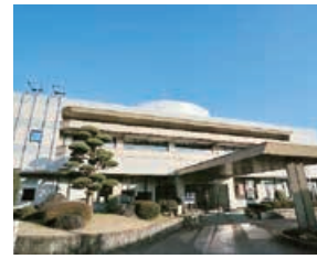
▲市役所分庁舎(寿2丁目)

3月中旬から4月中旬にかけては、入学や転勤等の住民異動で市民課窓口が大変混雑します。そこで市では、混雑緩和と待ち時間解消のため、次のとおり本庁の窓口業務時間を延長し、休日窓口を開設します。 なお、各総合支所・各出張所は、時間延長及び休日窓口の開設は行いませんので、ご注意ください。 ◎延長期間 3月22日(木)～4月6日(金)の平日17時15分～19時 ◎休日窓口 3月24日(土)・25日(日)、31日(土)・4月1日(日)の8時30分～17時15分 ※マイナンバーカード交付の取り扱いは、平日は18時30分まで、休日は16時30分まで ◎取扱業務 ○住民異動届(転入・転出・転居等) ○住民票・戸籍の交付、印鑑登録等 ○住民異動に伴う ① 国民健康保険の各種手続き ② 国民年金関係各種手続き