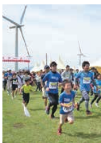
▲うわば公園の雄大な景色の中を駆ける

○申込期限 4月6日(金) 問 南日本クロスカントリー大会INきほく実行委員会(市民スポーツ課内・5階) ☎0994-31-1139