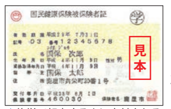
▲修学で転出する人に交付される国民健康保険被保険者証(右上に㊦と表示される)