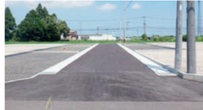
▲協議により、雨水を一時的貯蓄するための大型側溝を設置した事例