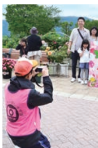
▲シャッター押します隊

〓 かのやばら祭り実行委員会事務局(市都市政策課公園管理室内・4階) ☎0994-31-1150