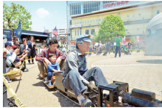
リナシティで過ごす 楽しい1日

5月13日、市立図書館及び市文化会館で、「第7回図書館まつり」が開催されました。寄贈された本を無料でプレゼントする名物の「ブックリサイクル」コーナーは、多くの人で、にぎわったほか、読書ボランティアによる「おはなし会」や津軽三味線演奏、火おこし・まがたま作り体験などの多彩な催しで、会場は活気にあふれていました。