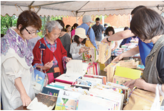
にぎわいをみせる 図書館まつり

5月13日、市立図書館及び市文化会館で、「第7回図書館まつり」が開催されました。寄贈された本を無料でプレゼントする名物の「ブックリサイクル」コーナーは、多くの人で、にぎわったほか、読書ボランティアによる「おはなし会」や津軽三味線演奏、火おこし・まがたま作り体験などの多彩な催しで、会場は活気にあふれていました。