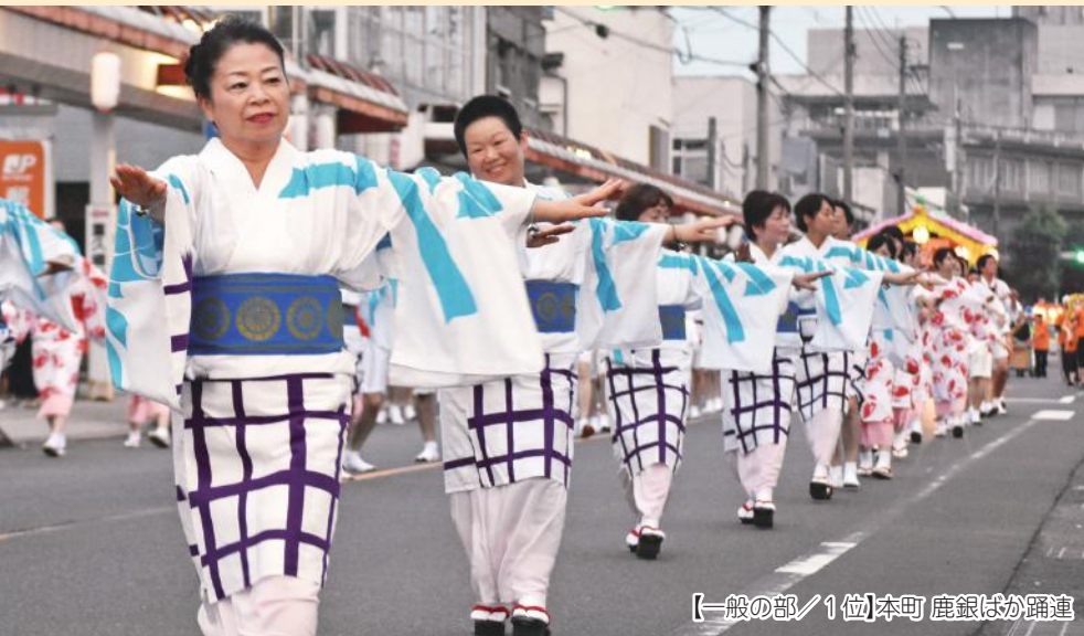
【一般の部/1位】本町 鹿銀ばか踊連