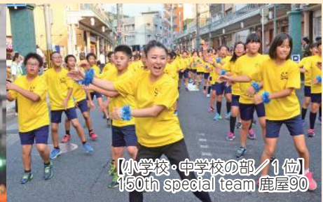
【小学校・中学校の部/1位】 150th special team 鹿屋90