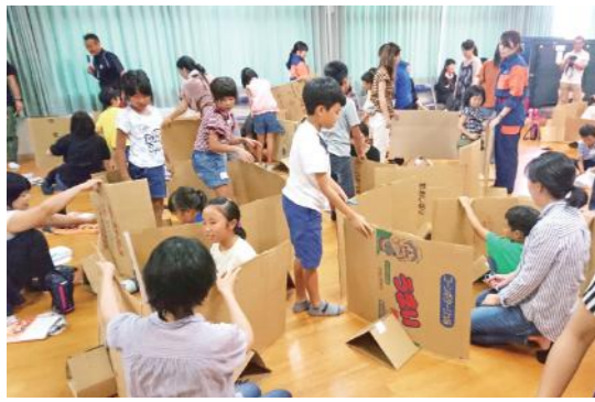
仮想「避難所」体験で 防災の意義を考える

7月28日、寿小学校で「夏休み防災DAYキャンプ」が開催されました。これは児童やその保護者に、防災意識を高めてもらおうと寿小PTAが主催したものです。参加者は、実際に避難所で使われている新聞紙スリッパやダンボール間仕切りの製作のほか、非常食の試食などを体験。初めての体験を楽しみながら、防災の大切さを改めて感じていました。