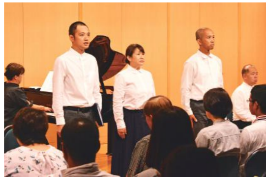
栃木の劇団が念願の 鹿屋公演を果たす

7月28日、寿小学校で「夏休み防災DAYキャンプ」が開催されました。これは児童やその保護者に、防災意識を高めてもらおうと寿小PTAが主催したものです。参加者は、実際に避難所で使われている新聞紙スリッパやダンボール間仕切りの製作のほか、非常食の試食などを体験。初めての体験を楽しみながら、防災の大切さを改めて感じていました。