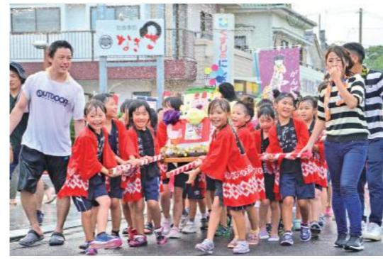
元気なかけ声が 暑さを吹き飛ばす

7月29日、リナシティかのやで、朗読劇「月光の夏」が開催されました。これは、栃木県足利市で活動する市民劇団「PPP45°」が、戦時中に特攻隊の最大出撃基地であった鹿屋で公演したいとの想いから実現したものです。朗読劇は、生き残った特攻隊員と周囲の人々の苦悩が描かれるストーリーで、参加者はその熱演に聞き入り、時に涙しました。