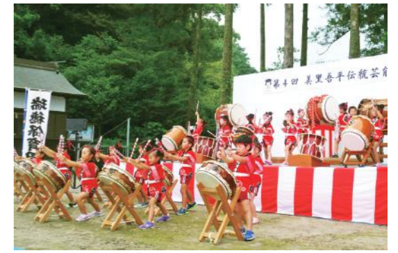
次世代へ受け継ぐ 吾平の伝統芸能

8月5日、吾平町で「美里あいら夏祭り」が開催されました。恒例のお神輿行列には、町内の子どもたちが製作したオリジナルの神輿が登場。参加者は会場の吾平町商店街を元気に練り歩き、見物に訪れた人たちに元気を与えました。また、夜には月見橋上流で花火大会があり、来場者は間近で打ち上がる約3,000発の花火を楽しみました。