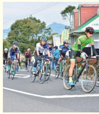
▲かのやサイクルフェスティバルは12月23日(日・祝)に開催

市内で開催するサイクリングイベントには、「ツール・ド・おおすみサイクリング大会」や「かのやサイクルフェスティバル」などがあります。