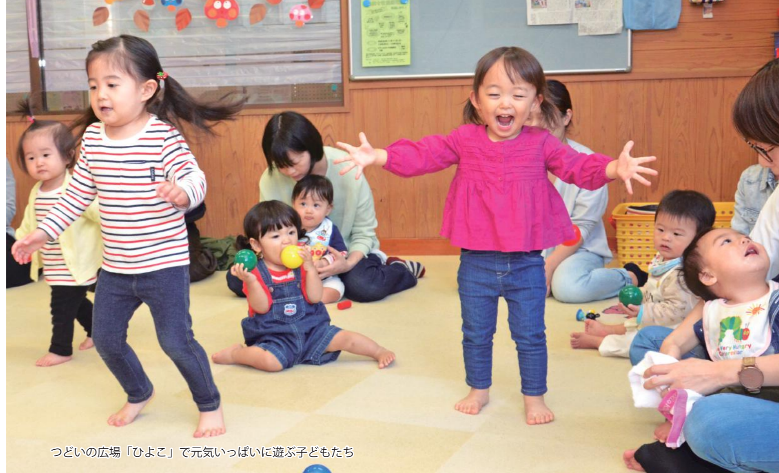
つどいの広場「ひよこ」で元気いっぱい遊ぶ子どもたち