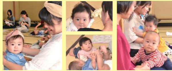
11月7日に開催された「ベビーマッサージ」にて