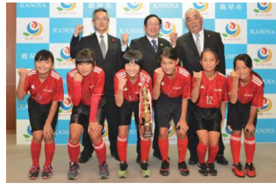
大隅から九州大会へ 12歳以下女子サッカー

11月24日・25日の2日間、「第18回ツール・ド・おおすみサイクリング大会」が開催されました。今年は、明治維新150周年記念の150kmコースを含む4つのコースで実施。489人の参加者は、途中でボランティアスタッフによるおもてなしを受けながら、鹿屋市・錦江町・南大隅町の美しい海岸線と走りごたえのある山間部でのサイクリングに挑みました。