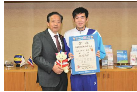
「水中の格闘技」 水球で福井国体優勝

11月21日、「大隅女子サッカーU-12」の選手と監督が市役所を訪れました。これは、11月24日・25日の九州大会へ出場を決めたことから行われたもの。同チームは、大隅地域の小学校やクラブのチームに所属する選手で構成され、毎月1回の練習に励んでいます。大隅から未来の「なでしこJAPAN」選手誕生へ、今後の活躍が期待されます。