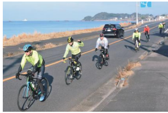
大隅の自然を体感 ツール・ド・おおすみ

11月24日・25日の2日間、「第18回ツール・ド・おおすみサイクリング大会」が開催されました。今年は、明治維新150周年記念の150kmコースを含む4つのコースで実施。489人の参加者は、途中でボランティアスタッフによるおもてなしを受けながら、鹿屋市・錦江町・南大隅町の美しい海岸線と走りごたえのある山間部でのサイクリングに挑みました。