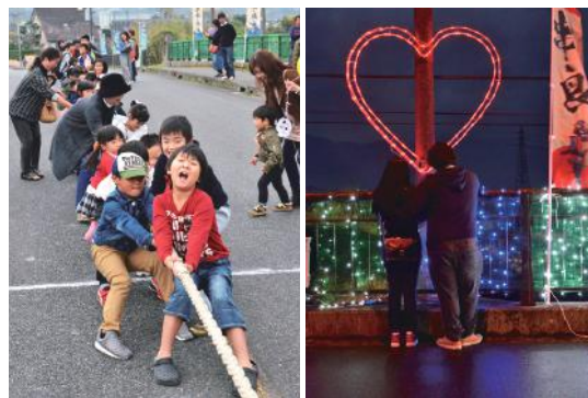
東西くしらをつなぐ 幻想的な「ヒカリ」

11月18日、細山田中学校で「第1回細山田からイモウィーン」が開催されました。これは地域おこし戦隊「細山ライ田一」と校区高齢者クラブが開いたもの。幼児から高齢者まで幅広い年齢層が参加し、グラウンドゴルフやニュースポーツに興じたほか、イベント名にちなんだ「からイモ」料理も振る舞われ、会場内は笑顔であふれていました。