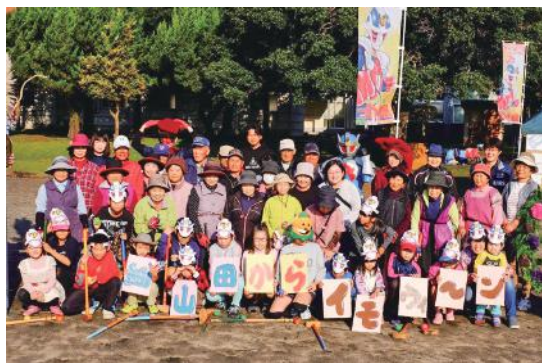
細山田で楽しく 世代間交流

11月18日、細山田中学校で「第1回細山田からイモウィーン」が開催されました。これは地域おこし戦隊「細山ライ田一」と校区高齢者クラブが開いたもの。幼児から高齢者まで幅広い年齢層が参加し、グラウンドゴルフやニュースポーツに興じたほか、イベント名にちなんだ「からイモ」料理も振る舞われ、会場内は笑顔であふれていました。