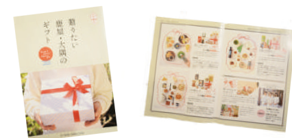
KITADA SARUGGAでは、ギフトのパンフレットを作成。予算や用途に合わせた組み合わせを選ぶことができます。