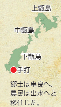
郷士は串良へ、農民は出水へ移住した。

当時の薩摩藩、中でも甑島では、度重なる飢饉で厳しい生活が強いられていました。貧窮にあえいだ甑島の郷士らは、生死をかけた藩に移住を嘆願。人口過疎である大隅半島への移住政策を採用していた藩は、甑島郷手打村から串良への移住願いを受け入れます。