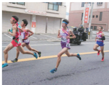
【右】1月に広島市で開催された全国都道府県駅伝大会で区間3位入賞（中央）【左】2月に鹿屋体育大学で行われた体力測定には将来有望な市内中学生アスリートが集められた（左から4人目）