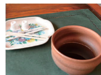
▲陶芸家である弘樹さんが作った器で頂くコーヒーは格別の味。

まだ構想段階ではありませんが、今後、コンテナを改装して、宿泊ができるゲストハウスにしたいと思っています。輝北のきれいな星も楽しむことができますので、ぜひお越しください。