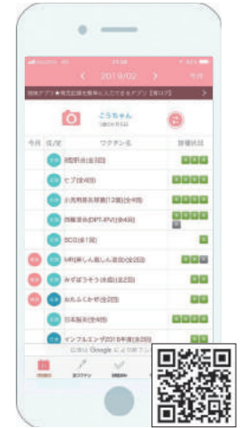
▲予防接種スケジュール