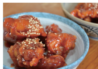
▲フライドチキンの中で1番人気のヤンニョム(甘辛)チキン。