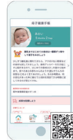
▲母子健康手帳アプリ