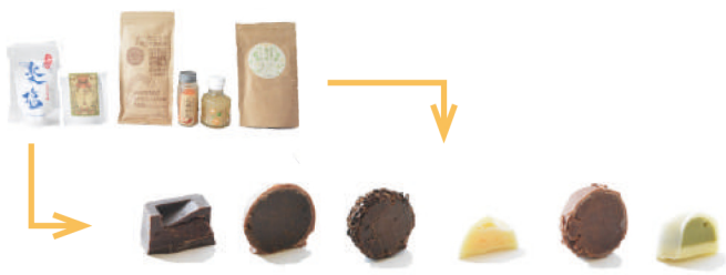
鹿屋・大隅の特産品（塩・ほうじ茶・玄米珈琲・花岡胡椒・辺塚だいたい・モリンガ）が、それぞれチョコレートに入り、食べる人を楽しませている。

地域の菓子店との連携 「KITADA SARUGGA」では、近隣の菓子店と連携した商品開発にも取り組んでいます。鹿屋・大隅の特色ある特産品が入った「チョコレート」WOWは、平成29年1月に、北田町の菓子店「杵屋モン・ドール」と連携する形で誕生しました。