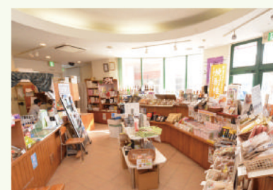
大手町1-1 リナシティかのや1階