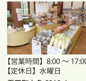
【営業時間】8:00～17:00 【定休日】水曜日 吾平町上名5318-4 Tel. 0994-58-8907

様々な種類のお菓子など探せる 市内には、今回ご紹介したものの以外にも、特色あるお菓子や特産品、農畜水産物が数多くあります。お土産や贈り物などには、物語が詰まった鹿屋のものを贈りませんか。