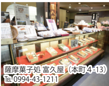
薩摩菓子処 富久屋（本町4-13） Tel. 0994-43-1211