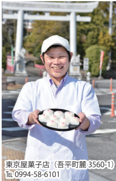
東京屋菓子店（吾平町麓 3560-1） Tel. 0994-58-6101