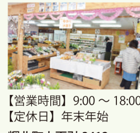
【営業時間】9:00～18:00 【定休日】年末年始 輝北町上百引3412 Tel. 099-486-0700