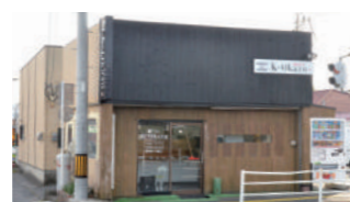
「K-okazu」(寿 5-25-7) 営業時間：10:30～18:30 定休日：月曜日 (祝日の場合は、火曜日) Tel 080-5271-7279

鹿屋の野菜は新鮮でおいしいので、できるだけたくさん使用して作っています。また、香辛料の多くは韓国から仕入れ、本場の味をベースに、日本人に合う味付けに調整しているので、芋焼酎とも相性抜群ですよ。文化の違いはありますが、鹿屋は親切な人ばかりで、私にとって第二の故郷だと思っています。