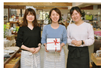
KITADA SARUGGA（北田町8-9） Tel. 0994-45-6168