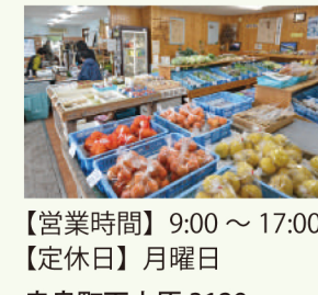
【営業時間】9:00～17:00 【定休日】月曜日 串良町下小原3129 Tel. 0994-63-7692