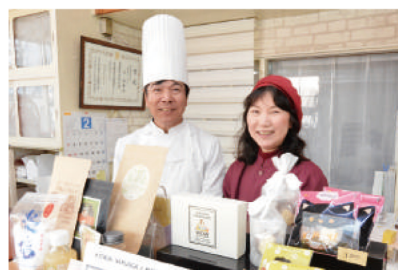
杵屋モン・ドール（北田町4-10） Tel. 0994-43-7109

「このチョコを作ったことがきっかけで、素材を生産された方々とのつながりができました。『自分が作った特産品がチョコになるなんて、ありがたい』との声をいただきと、やってよかったと思います。」 また、周辺の店舗と一緒に取り組むことでお客様に互いの店を紹介できるので、店を巡る人が増えていると感じます。当店の周辺には、桜や眺望の見事な城山公園、長寿坂、水神ひろばなど、素敵な場所がたくさんあります。ぜひ歩いて巡って、街の魅力を知ってほしいです」 一つのチョコレートが、生産者と街をつないでいます。