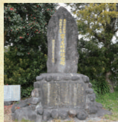
富ヶ尾では毎年3月に移住記念祭を行い、祖先の苦勞や遺徳を伝え継いでいる。今年は24日（日）に開催。

串良町有里の富ヶ尾中央公民館広場にたたずむ「富ヶ尾移住記念碑」。これは、今から235年前の天明4年（1784年）に、甑島郷手打村から郷士48家が富ヶ尾に移住したことを記念して建てられたものです。