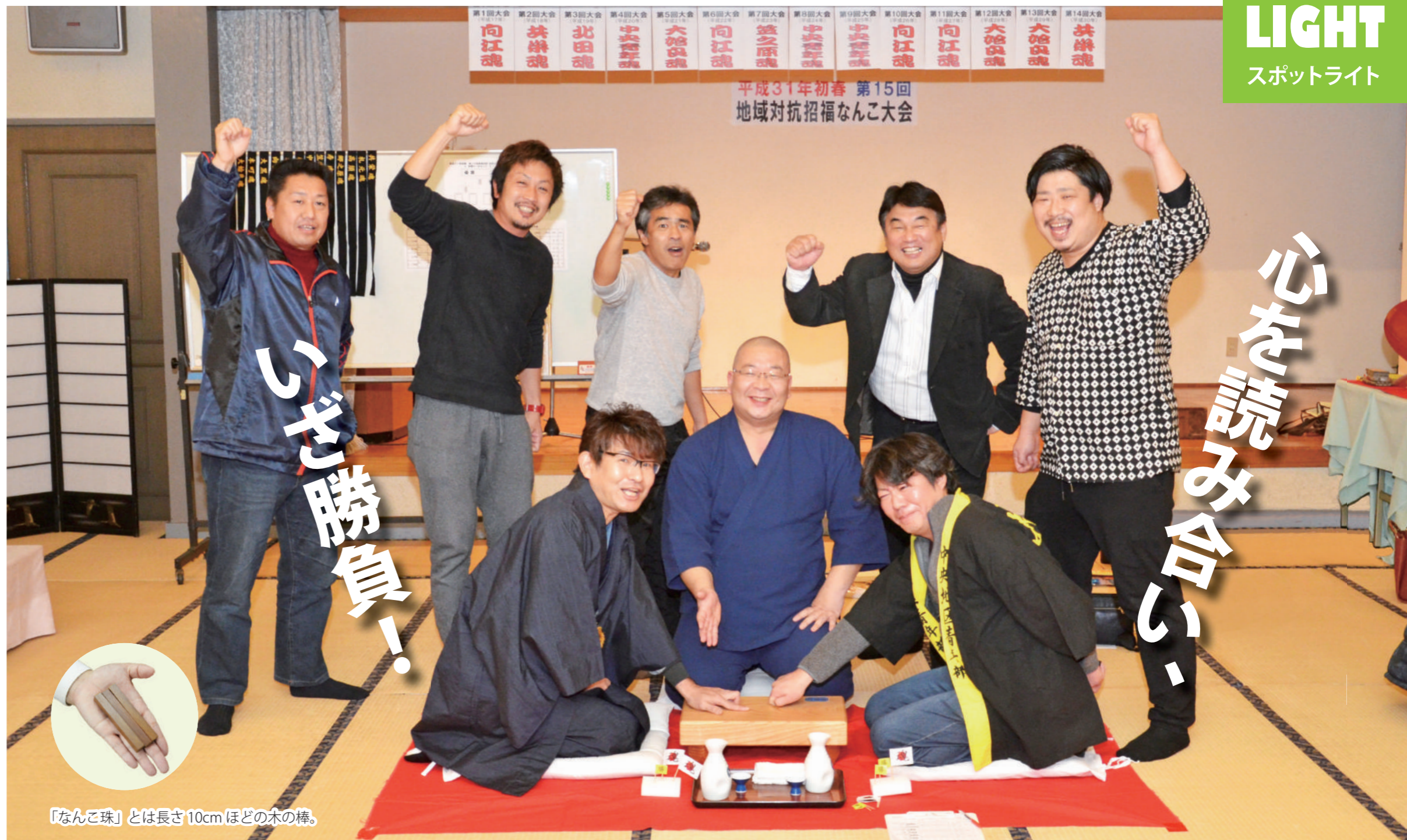
「なんこ珠」とは長さ10cmほどの木の棒。