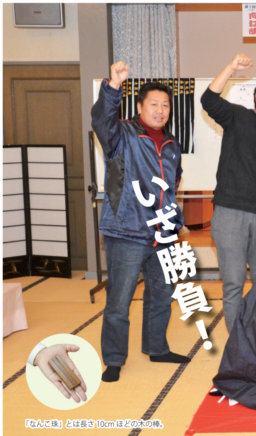
「なんこ珠」とは長さ10cmほどの木の棒。

入学・卒業式や記念日などのお祝い事の日、紅白の落雁（もしこ・もひこ）を配る光景が、昔はよく見られました。写真は、米粉や砂糖で作る落雁をかたどるための「菓子木型」で、数十年前に市内の老舗菓子店で使われていたもの。たくさんの人に、慶びと彩りを与えた、お菓子にまつわる道具です。