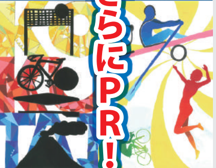
▲鹿屋高校生が製作したデザイン画の一部