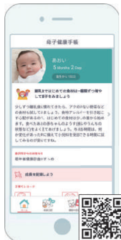
▲母子健康手帳アプリ