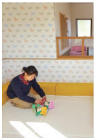
▲昨年園内に完成した授乳室・救護室

広 報かのや2月号は、とても興味深いものでした。今まで納めるだけで何に使われているか考え