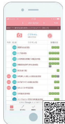
▲予防接種スケジュール