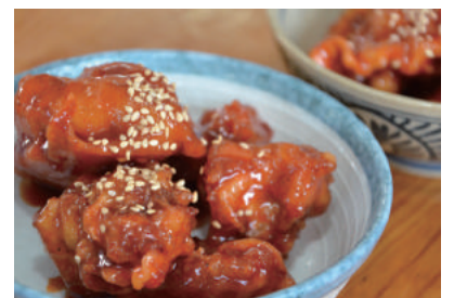
▲フライドチキンの中で1番人気のヤンニョム(甘辛)チキン。