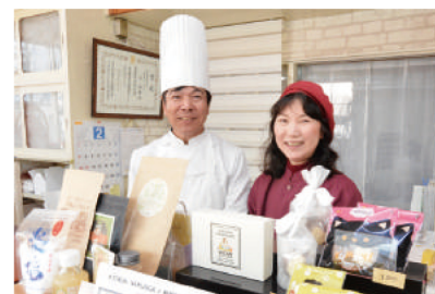
杵屋モン・ドール（北田町4-10） Tel 0994-43-7109

鹿屋・大隅の特産品（塩・ほうじ茶・玄米珈琲・花岡胡椒・辺塚だいたい・モリンガ）が、それぞれチョコレートに入り、食べる人を楽しませている。