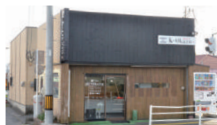
「K-okazu」(寿 5-25-7) 営業時間：10:30～18:30 定休日：月曜日 (祝日の場合は、火曜日) Tel 080-5271-7279

今後は、ほかに良い場所があれば店舗数を増やして、もっとたくさんの人に韓国の惣菜を食べてもらいたいです。