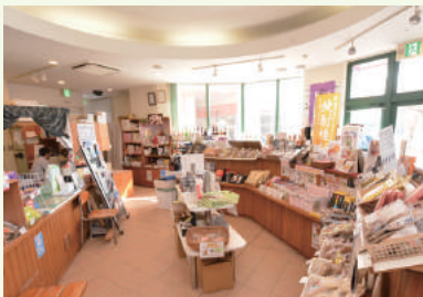
大手町 1-1 リナシティかのや 1階