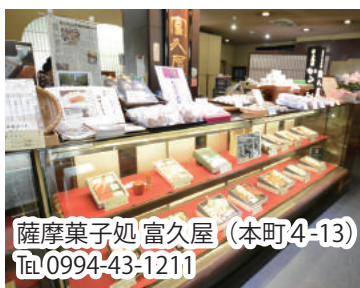
薩摩菓子処 富久屋 (本町4-13) Tel.0994-43-1211