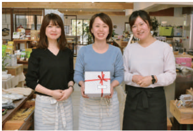
KITADA SARUGGA (北田町 8-9) Tel 0994-45-6168

ら直接話を聞くことで、お客様への商品説明にも、自然と力が入ります」と話します。 ギフトを贈る人から贈られる人へ、生産者の物語は伝わっていきます。