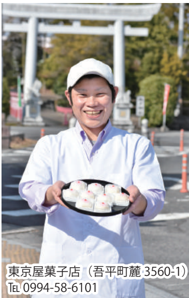
東京屋菓子店 (吾平町麓 3560-1) Tel. 0994-58-6101