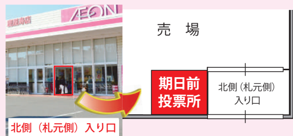
▲「マックスバリュ鹿屋寿店(寿3丁目)」の北側(札元側)入り口から入って、左側に期日前投票所を設置します