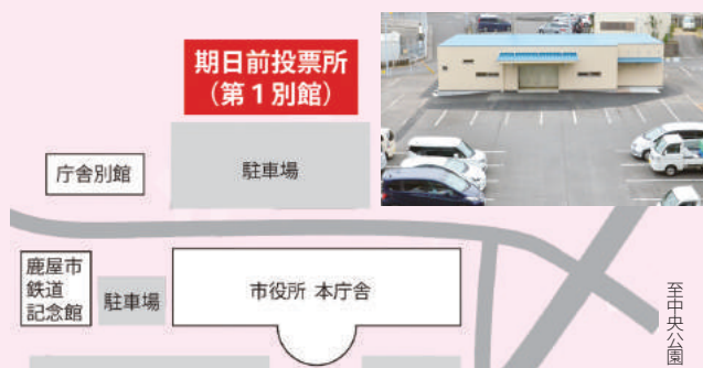
▲市役所第1別館駐車場

今回の県議会議員選挙では、3月30日(土)から4月6日(土)まで、鹿屋・輝北・串良・吾平の各地区及び「マックスバリュ鹿屋寿店」に期日前投票所を設置します。