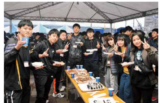
ようこそ、鹿屋へ! 体大の新入生を歓迎

4月3日、NPO法人コメリ災害対策センターと市との「災害時における協力に関する協定調印式」が行われました。これは、市内で災害が発生又は発生するおそれがある場合に、避難所等で必要な物資の供給や「コメリパワー鹿屋店」の駐車場を応急救護所等として活用することを目的に締結したものです。これにより、災害時の迅速な対応が期待されます。