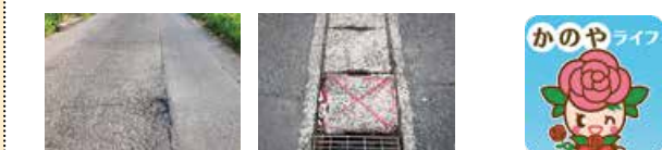
▲道路の異常箇所の例(穴ぼこ、蓋板割れ) ▲「かのやライフ」