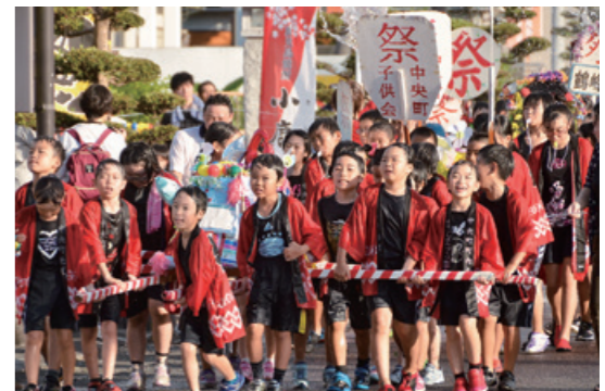
暑さを吹き飛ばす 威勢のよいかけ声

8月2日、第一鹿屋中学校女子バレーボール部の選手・監督らが市役所を訪れました。これは、7月に開催された「令和元年度鹿児島県中学校総合体育大会バレーボール競技大会」女子の部で初優勝し、8月に熊本県で開催される九州大会への出場が決定したことに伴い行われたもの。「超攻撃的」と語るチーム編成での全国大会出場へ決意を誓いました。