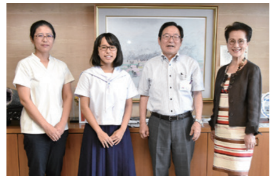
カンボジアでの 貴重な経験を報告

8月4日、高須町で祇園祭が行われ、5つの舞からなる刀舞(市指定無形民俗文化財)の一行が、波之上神社を出発し町内を練り歩きました。道中、奇声を発する田の神や「ウワー」と叫ぶ鬼神が近付くと、見物に来ていた子どもたちは大泣き。大人たちはその様子をにこやかに見守りながら写真に収め、子どもたちの成長を願っていました。