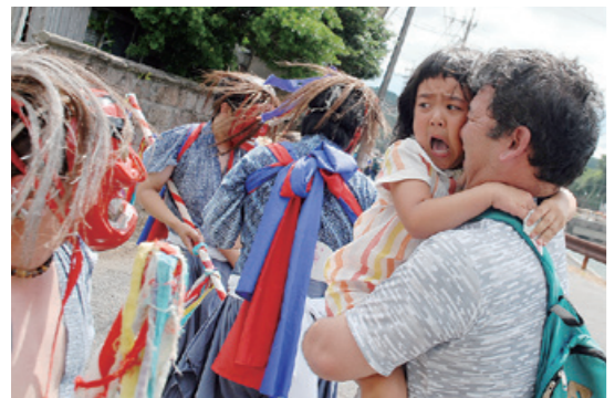
高須に響く 泣き声と笑い声

8月4日、高須町で祇園祭が行われ、5つの舞からなる刀舞(市指定無形民俗文化財)の一行が、波之上神社を出発し町内を練り歩きました。道中、奇声を発する田の神や「ウワー」と叫ぶ鬼神が近付くと、見物に来ていた子どもたちは大泣き。大人たちはその様子をにこやかに見守りながら写真に収め、子どもたちの成長を願っていました。