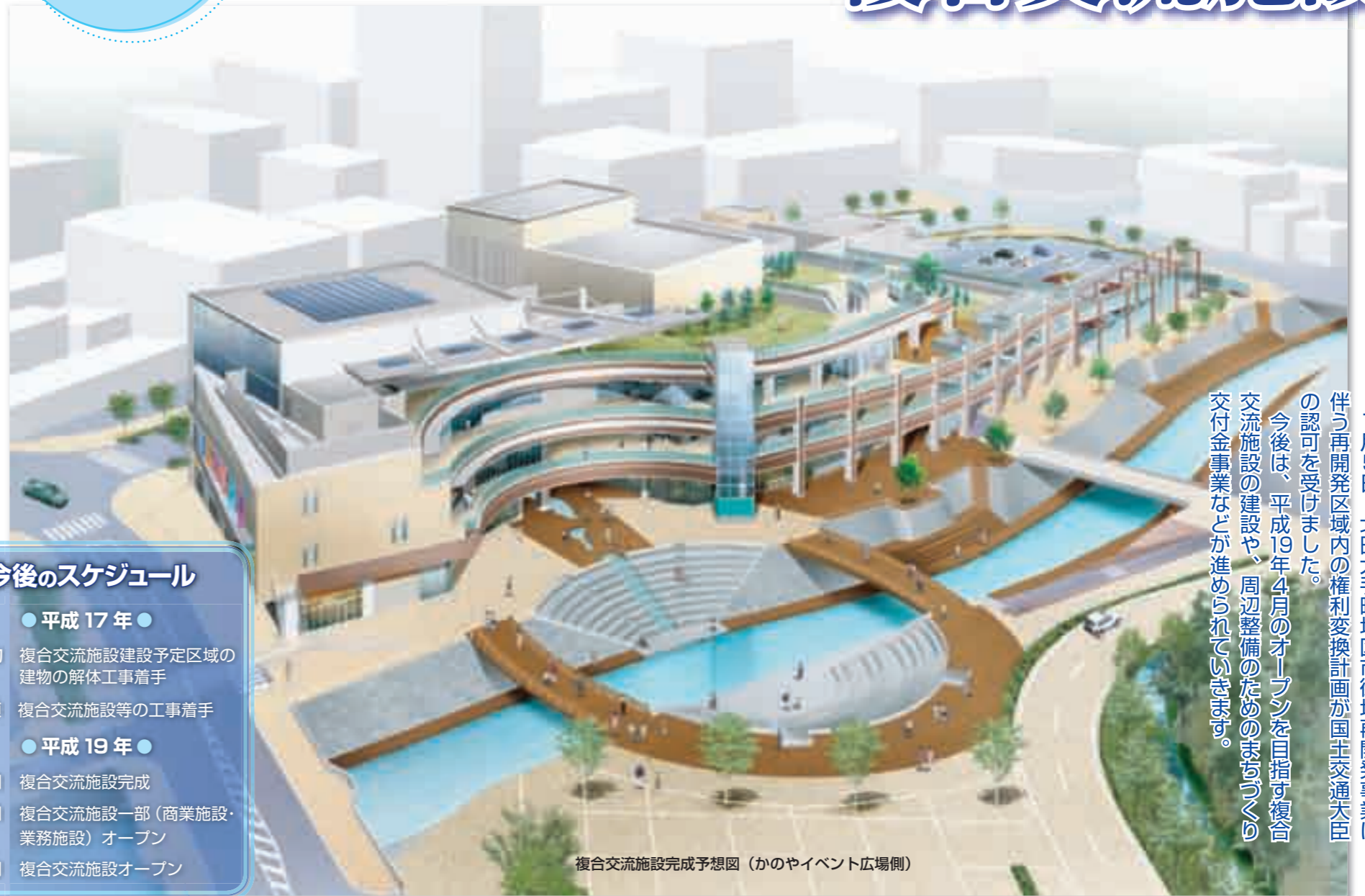
複合交流施設完成予想図（かのやイベント広場側）

7月5日、北田大手町地区市街地再開発事業に伴う再開発区域内の権利変換計画が国土交通大臣の認可を受けました。 今後は、平成19年4月のオープンを目指す複合交流施設の建設や、周辺整備のためのまちづくり交付金事業などが進められていきます。