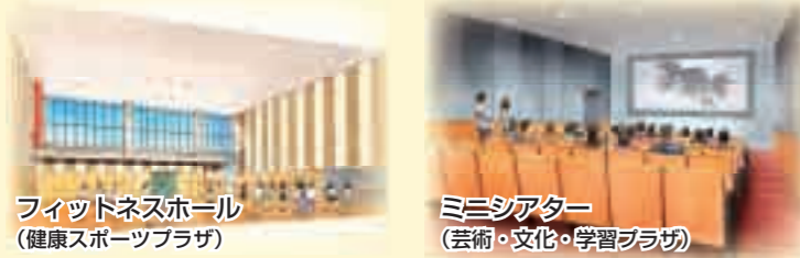
フィットネスホール (健康スポーツプラザ)