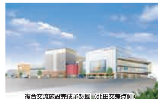
複合交流施設完成予想図（北田交差点側）

市では、平成11年3月に策定した鹿屋市中心市街地活性化基本計画に基づき、中心市街地の整備改善と商業等の活性化を目指すため、独立行政法人都市再生機構、鹿屋商工会議所、(株)まちづくり鹿屋とともに、北田大手町地区市街地再開発事業を進めています。事業の中心となる4階建ての複合交流施設は、商業施設をはじめ、情報プラザ、芸術・文化・学習プラザ、福祉プラザ、健康スポーツプラザなどの公共施設を各階に配置し、市民が集うふれあいの場となるよう整備します。