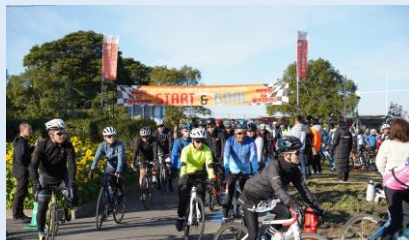
ツール・ド・おおすみサイクリング大会