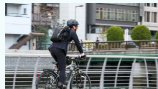
通勤等の自転車利用