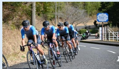
JBCFサイクルロードシリーズ開幕戦