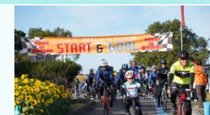
サイクリングイベント