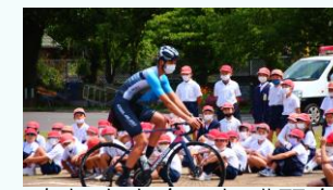
自転車安全運転講習会