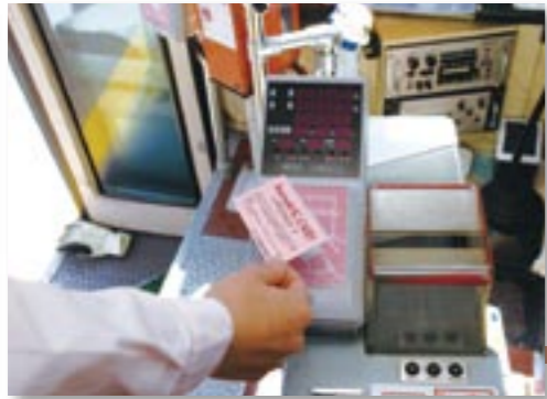
バスの利用を快適にしてくれる ICバスカード