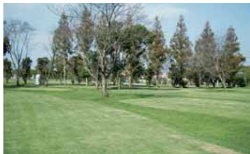
コース脇には、たくさんの樹木があります。