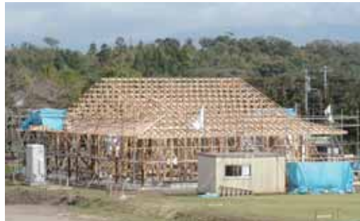
現在、クラブハウス等の整備が進められています。