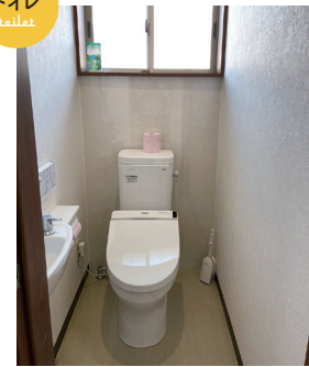
男性用と女性用、多目的用とがあり、混み合うことなく快適に利用できます