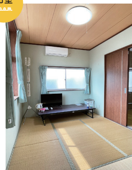
南向きで明るく高限山も望めます