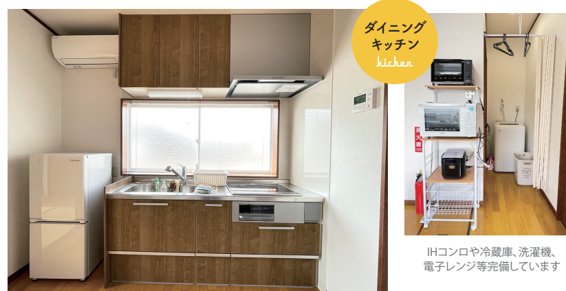
ダイニングキッチン kitchen