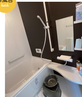
追い炊き機能付きです