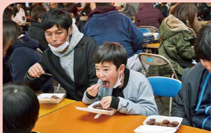
2月 リナシティまるごと食フェス 市内の飲食店15店が自慢の肉料理を提供し、牛・豚・鶏・魚といった鹿屋の「食」の魅力を発信しました。