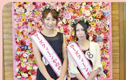
5月 第7代ローズクイーンかのやコンテスト 鹿屋市のPR活動を担う「第7代ローズクイーンかのや」が誕生しました。