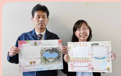
1月 オリジナル婚姻届・出生届の配付開始 提出した記念に受け取れる「オリジナル婚姻届・出生届」の配付が始まりました。