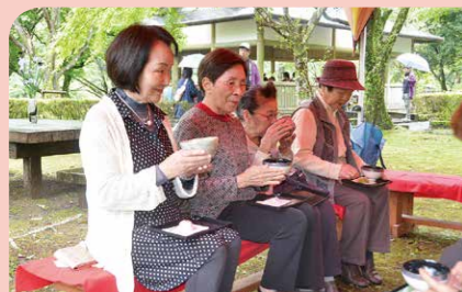
5月 元号が「令和」に改元 吾平山陵公園では、多くの人々が新緑の中でお茶と和菓子を堪能し、記念すべき令和の初日を楽しんでいました。