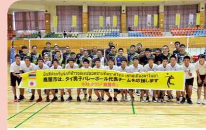
8月 タイ王国男子バレーボールナショナルチームがキャンプ 昨年の女子に続き、ホストタウン・鹿屋市でキャンプや市民との交流が行われました。