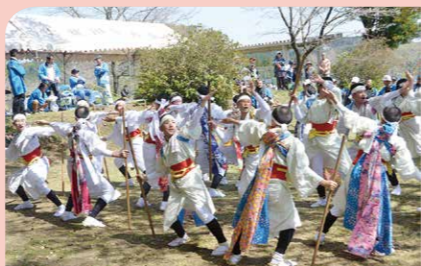
3月 瀬戸山神社の春祭り 上祓川町・祓川町・下祓川町・西祓川町の保存会が一堂に会し、五穀豊穡と無病息災を願う棒踊りが披露されました。