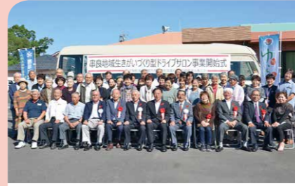
10月 串良でドライブサロンが始まる 観光や買い物などへの移動を支援する「生きがいづくり型ドライブサロン事業」が、串良地域で始まりました。