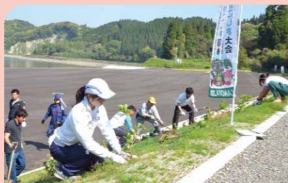
4月 輝北ダム平房公園にアジサイを植栽 「燃ゆる感動がごしま国体」に全国から訪れる人を歓迎するために、地域住民やボランティア関係者が350本の苗を植栽しました。