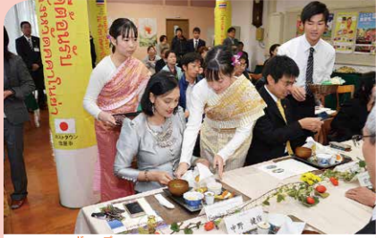
11月 GAP食材を活用したタイ王国のおもてなし料理試食会 鹿屋農業高校産の食材を使い、鹿屋中央高校の生徒が料理を振る舞いました。