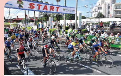
9月 かごしま国体ファンライド2019 国体1年前特別イベントに71人が参加し、全長31.5kmの市内特設コースを国体選手の気分を味わいながら走行しました。