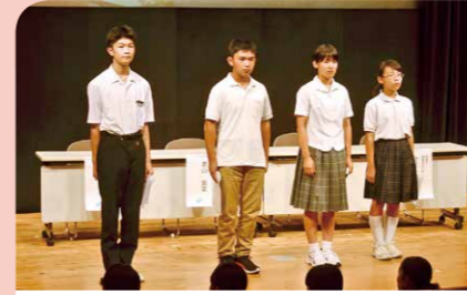
8月 旧海軍飛行場ゆかりの地である4市の生徒が鹿屋市に集結 「かのや未来創造プログラム～平和の花束2019～」でシンポジウム等が行われました。