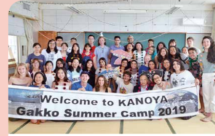
6月 ユクサおおすみで「Gakkoキャンプ」 国際的なサマーキャンプに鹿屋高校の生徒3人が参加し、ワークショップや体験を通じて、世界中の中高生と交流を深めました。