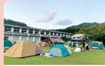
7月 神野小学校跡に「神野」山の学校キャンプ場がオープン しし肉のバーベキューや神野地区の自然等を楽しめるキャンプ場がオープンしました。