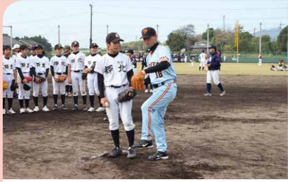
12月 ドリーム・ベースボール 元プロ野球選手による野球教室や鹿屋市選抜チームとの試合が行われ、華麗なプレーで訪れた多くの野球ファンを魅了しました。