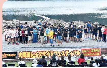
10月 鹿屋市復興祭 平成28年に大隅半島に大きな被害を与えた台風第16号からの復旧と復興を祝い、ステージイベントや花火などが行われました。