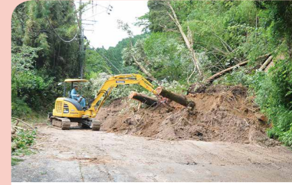
7月 大雨により市内各地で被害が発生 6月から降り続いた大雨で、土砂崩れによる農地や牛舎等の被害のほか、家屋の浸水や停電、断水などの被害が発生しました。