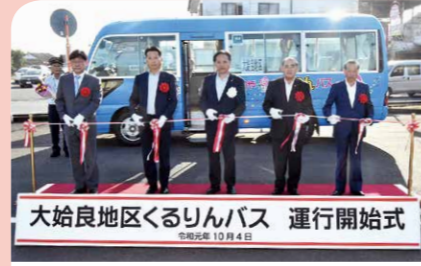
10月 くるりんバス「市街地北ルート」・「大始良ルート」運行開始 さらなる利便性の向上に向けて、新たに2つのルートでの運行が始まりました。