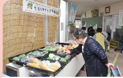
10月 輝北ふれあいセンターで住民主体の新たな取り組みが始まる 福祉の拠点施設として、住民による移動支援や、食堂・市場の出店が始まりました。