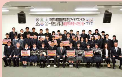
1月 高校生アイデアコンテスト 若者のまちづくりへの関心を高めることを目的に初開催し、市内の6校12チームがユニークなアイデアを発表しました。