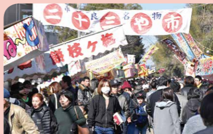
1月 くしら二十三や市 串良総合支所周辺に約300店が軒を連ね、植木や刃物、陶器等の買い物を楽しむ人など、多くの来場者でにぎわいました。