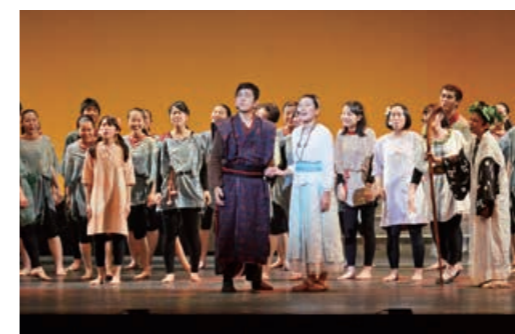
13回目となる公演は2月8日(土)・9日(日)に開催されます。(21ページに関連記事有り)

古墳時代の奄美大島の巫女「ヒメ」と大隅の王「ヒコ」の交流を描いたミュージカル「ヒメとヒコ」は、2月に13回目の公演を迎えます。今回の主要キャストは市内の高校に通う15人。週3回の稽古では、演技や歌だけでなく基礎体力を養うための筋力トレーニングやランニングも欠かせません。年末には合宿を行いメンバー同士の結束をより一層強めるなど、1年かけて作品を作り上げます。「ヒメとヒコ」の魅力は高校生とは思えない迫力ある演技や歌唱力。観客を魅了するパフォーマンスが話題を呼び、市内外のイベントで歌や踊りを披露するなど、舞台以外でも活躍の場が広がっています。若さあふれる素晴らしい舞台を、ぜひ体感してみませんか。