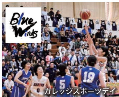
Blue Winds 鹿屋体育大学と市では地域密着スポーツブランド「Blue Winds」を生かしたイベント等に取り組んでいる。

また、合宿者のおもてなしや宿泊会場までの輸送などを一体的に引き受けようと、宿泊施設・バス会社・弁当事業者・体育協会などと一緒に「かのやスポーツコミッション」による受け入れ体制も整備しています。これらを生かし2万4千人の合宿