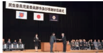
▲12月3日に市文化会館で行われた辞令伝達式