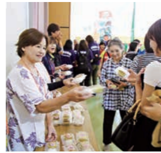
国体リハーサル大会での市民によるおもてなしの様子。本選大会でも全国から多くの選手・関係者が鹿屋を訪れる。

国体に関しては、地元の皆さんのおもてなしや子どもたちの「花いっぱい運動」があり、会場での様々なボランティアも募っています。より参加しやすい仕組みを作り、市民の皆さんにも色々な形で国体に参加していただきたいと思っています。