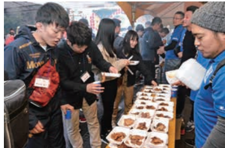
毎年4月に市内の各団体が協力して開催する、鹿屋体育大学の新入生歓迎会。市外出身者の多い学生が、鹿屋の食を楽しみ、市民・地域と交流できる場となっている。

市長 昨年はラグビーワールドカップで日本中が大変盛り上がりました。スポーツは人々を感動させるものだと改めて強く感じました。スポーツを「する」側とすれば、スポーツは絆を作り友情を育み、人生を豊かにするものだと思います。トップアスリートを育てることも重要ですが、それ以上に多くの方がスポーツに親しみ、健康づくりと仲間づくりをできるのがスポーツの大きな力だと思っています。今後も市民の皆さんが身近なところでスポーツに親しめるような環境づくりをしなければと思います。 私自身はロードバイクでの運動を楽しんでいます。自転車だと遠くに