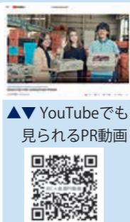
YouTubeでも見られるPR動画

タイの「ABC キッキングスタジオ」の講師によって本市の食材の特徴とタイの市場ニーズを合わせたレシピが開発され、現地の人を対象とした料理教室が開催されました。