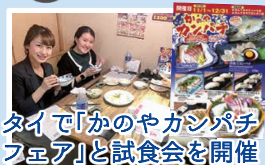
タイで「かのやカンパチフェア」と試食会を開催

11～12月の2か月間にわたって、タイの飲食店2店舗で「かのやカンパチフェア」が開催されました。試食会では現地の輸入業者や関係機関等を交えて、意見交換が行われました。