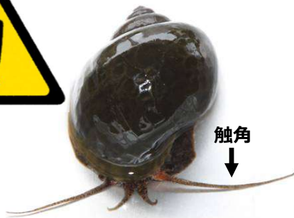
ジャンボタニシ (スクミリングイ)