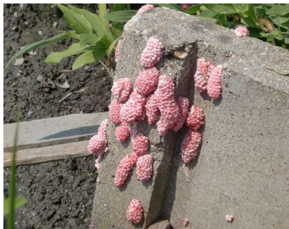
用水路（水口）の卵塊