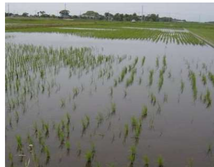
食害を受けた水田