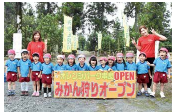
最後の開園を迎えた オレンジパーク串良

10月8日、市役所で、「フォトドラアワード」の認定式が行われました。これは、写真を撮りにドライブで出掛けたい場所を選ぶ「かごしまフォトドライブプロジェクト」のお勧めスポットに、市内の「荒平天神」、「輝北天球館」、「神徳稲荷神社」が選定されたことによるもの。今後、テレビ番組や特設ホームページ等で紹介される予定です。