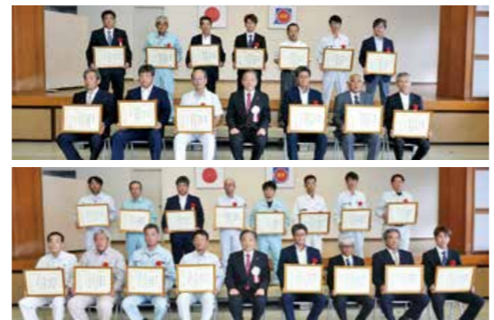
優良工事に携わった 企業と技術者を表彰

10月8日、鹿屋港で、「令和元年度鹿屋市総合防災訓練」が実施されました。自衛隊や地元町内会など32の関係機関・団体約440人が参加したこの日の訓練では、大雨が降る中で大規模地震が発生したことを想定。孤立者などの救出訓練、道路・ライフライン復旧訓練など15項目の実践的な訓練が行われ、災害時の連携強化を図りました。