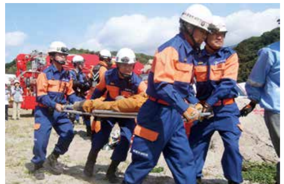
災害発生に備えた 総合防災訓練

10月8日、鹿屋港で、「令和元年度鹿屋市総合防災訓練」が実施されました。自衛隊や地元町内会など32の関係機関・団体約440人が参加したこの日の訓練では、大雨が降る中で大規模地震が発生したことを想定。孤立者などの救出訓練、道路・ライフライン復旧訓練など15項目の実践的な訓練が行われ、災害時の連携強化を図りました。