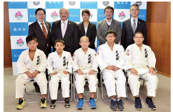
昨冬の雪辱を果たし 2連覇を達成

12月26日、田崎小学校金管バンドのメンバーが市役所を訪れました。これは14・15日に行われた「第46回鹿児島県吹奏楽アンサンブルコンテスト」で金賞を受賞したことに伴い行われたもの。同バンドの金賞受賞は9度目で、メンバーは「2月に行われる九州大会では前年より上の順位を獲りたい」と今後の抱負を語りました。