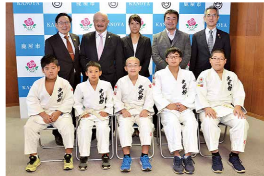
昨冬の雪辱を果たし 2連覇を達成

12月26日、田崎小学校金管バンドのメンバーが市役所を訪れました。これは14・15日に行われた「第46回鹿児島県吹奏楽アンサンブルコンテスト」で金賞を受賞したことに伴い行われたもの。同バンドの金賞受賞は9度目で、メンバーは「2月に行われる九州大会では前年より上の順位を獲りたい」と今後の抱負を語りました。