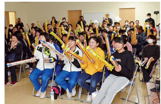
鹿屋からタイへ 熱い声援を送る

12月26日、市役所で、「かのや100チャレ成果発表会inかのや」が開催されました。「かのや100チャレ」とは、首都圏の中高生が鹿屋市の課題解決を考える取り組み。発表会では、「かのや100チャレ」で最優秀賞を受賞した本郷中学・高校(東京都)の生徒と、鹿屋高校、串良商業高校、楠集中学・高校の生徒が解決策を発表し、お互いのアイデアに刺激を受けながら交流を深めました。