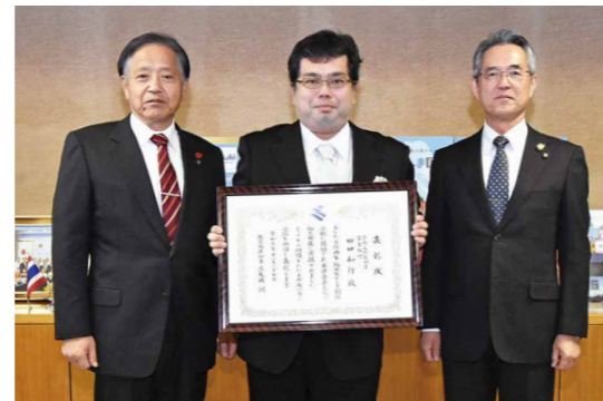
鹿屋での作曲活動 さらなる活躍に期待

1月12日、平和公園屋内練習場で、プロ野球選手による野球教室が開催されました。111人の小中学生に指導したのは、自主トレーニングで市内を訪れていた細川亨選手(千葉ロッテマリーンズ)ら4人の選手。参加した子どもたちは打撃練習と守備練習に分かれ、効果的な練習方法や野球に対する心構えなどを学びました。