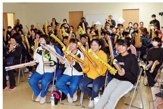
鹿屋からタイへ 熱い声援を送る

12月26日、市役所で、「かのや100チャレ成果発表会inかのや」が開催されました。「かのや100チャレ」とは、首都圏の中高生が鹿屋市の課題解決を考える取り組み。発表会では、「かのや100チャレ」で最優秀賞を受賞した本郷中学・高校(東京都)の生徒と、鹿屋高校、串良商業高校、楠隼中学・高校の生徒が解決策を発表し、お互いのアイデアに刺激を受けながら交流を深めました。