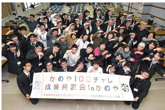
「100チャレ」の輪が 首都圏と鹿屋をつなぐ