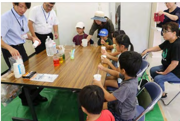
【理科実験教室！】 （アトリエ・絵画） スライムやバルーンフォンの作成等、様々な理科実験を行い、子どもたちが笑顔に。