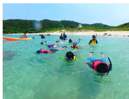
シュノーケリング