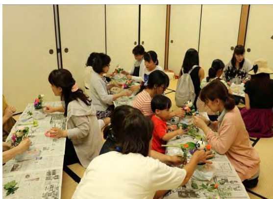
【いけばな体験】(和室・茶室) 参加者から、気軽に生け花の体験ができて嬉しいとの声。