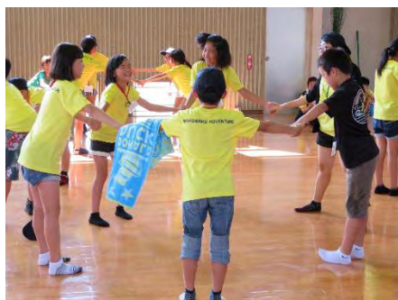
南種子町子連との交流活動