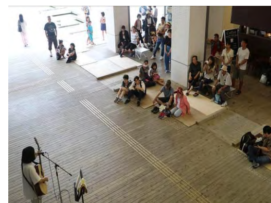
【ミニコンサート】(ガレリア) 各自持ち時間30分で、全9組が次々にパフォーマンス。かのや夏祭りの出店との相乗効果で、集客も上々。幅広いジャンルの演奏で、観客を魅了していました。