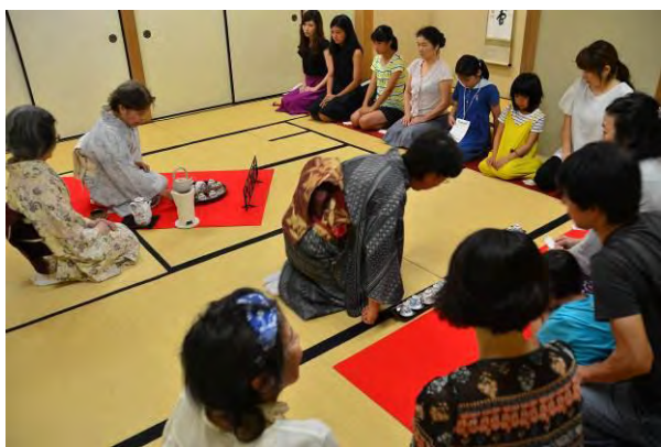
【着付け・お茶体験】(和室・茶室) 幼児から大人まで、着付けやお茶の体験を楽しみ、大変好評でした。