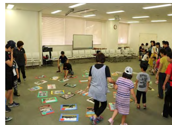
【デッカルタ大会・読み聞かせ】(情報研修室) 中高生ボランティアクラブ「鹿屋っ子」による企画で、幼児が多数参加。