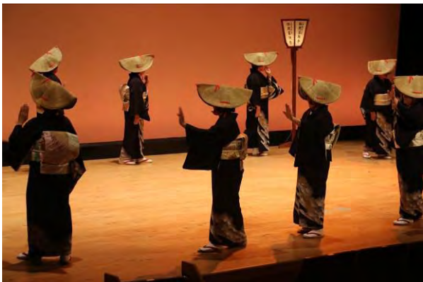
【郷土芸能】（ホール） 鹿屋市の無形民俗文化財。今回は高須町刀舞や吾平町そば切り踊り等、6団体が登場。