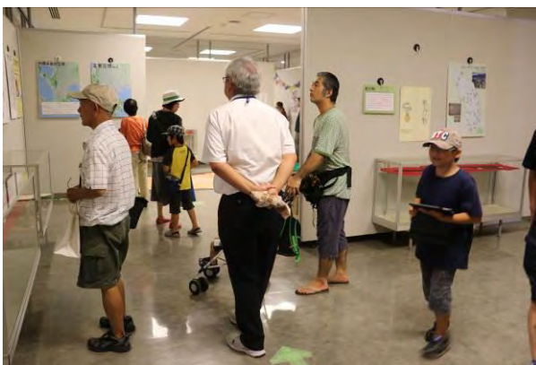
【象嵌装大刀の世界展】（ギャラリー） 象嵌装大刀（本物・レプリカ）の展示のほか、鹿屋市初展示の銅鑿 どうのみ に興味津々といった様子。