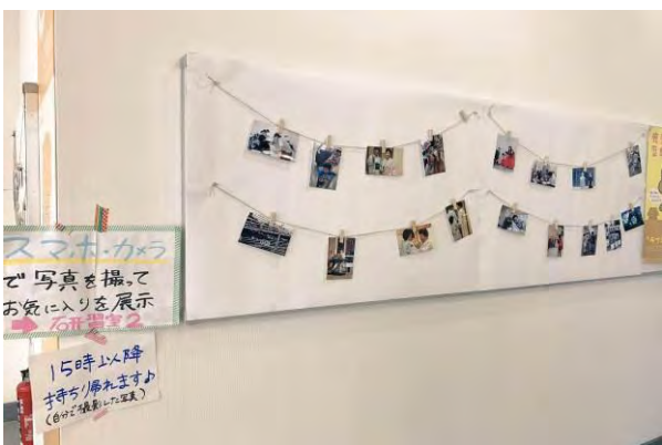
【みんなで作るその日の写真展】 （研修室2） 午後から舞台をギャラリーに移し、参加者の写真を飾る試み。素敵な写真ばかりでした。