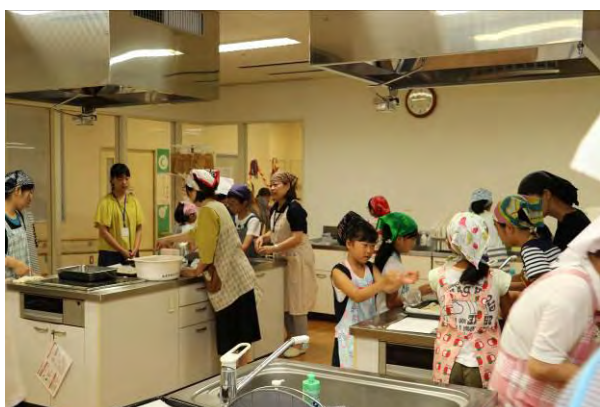
【親子で郷土のお菓子作り教室】(調理室) オカラのクッキーや芋団子など、素朴なお菓子作りを親子で楽しく体験。9組参加。