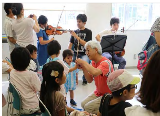
【健康マージャン・オーケストラの楽器】 （研修室3） 大人から子供まで初めての体験ができた1日でした。