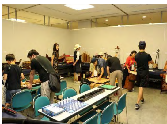
【出張民族館】（ギャラリー） 世界各国の珍しい楽器やボードゲームなどが設置してあり、参加者が気楽に演奏やゲームを習いながら楽しみました。