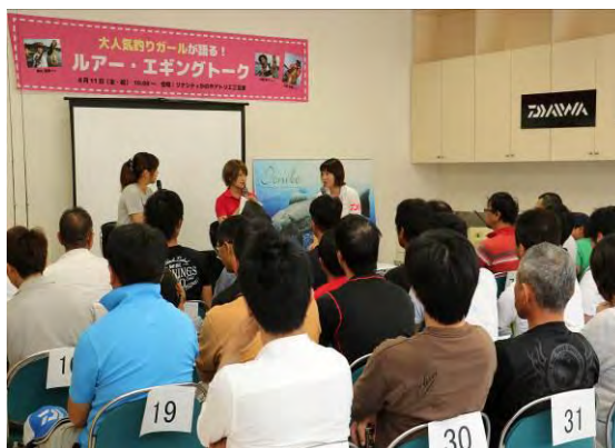
【釣りガールトークショー】 （アトリエ・工芸） TV等で活躍中の秋丸美帆さんをはじめ、3名の爆笑トークで大盛況。