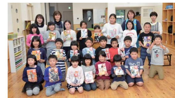
▲3月14日、地域活性化に取り組む団体「上小原ふるさとの会」が、上小原児童クラブに対し、給食食材費と本のプレゼントを行いました。