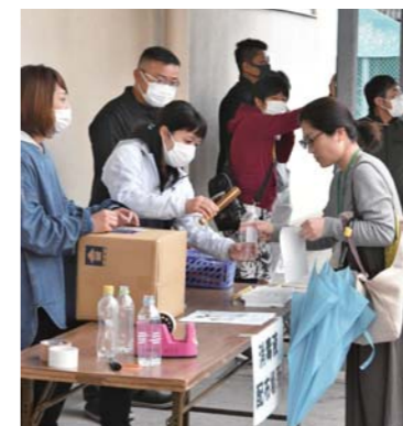
▲3月22日、寿小学校で、その児童がいる家庭への消毒液(次亜塩素酸)の無料配布が行われました。これは市中での消毒液の不足を受け、同校PTAが何かできないかと企画し実施したものでした。