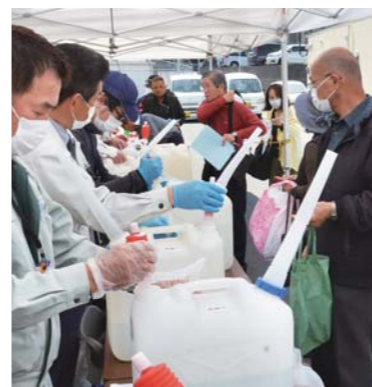
▲3月20日から、市では市内の福祉施設等や市民・事業所に、除菌に効果があるとされる酸性電解水の配布を始めました。この取り組みには、有限会社三味堂(新栄町)、株式会社中央電機(笠之原町)、株式会社元幸産業(串良町有里)の協力をいただきました。