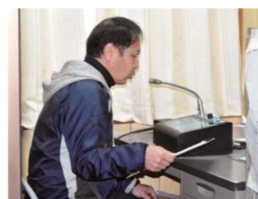
◀3月6日、笠野原小学校の教員が、町内放送等を使って臨時休業期間中で自宅にいる子どもたちを励ますための放送を行いました。これは学校からの相談に笠之原町内会が協力し行われたものでした。