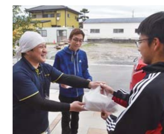
▲おおすみ弁当札元店では、学校の臨時休業期間中、鹿屋東中学校区内で子どもがいる共働き世帯・1人親世帯を対象とした昼の弁当配達サービスを始め、この取り組みに多くの企業が協力しました。