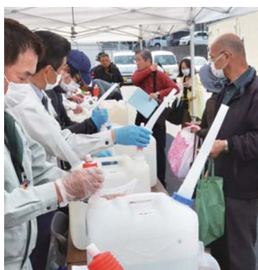
▲3月20日から、市では市内の福祉施設等や市民・事業所に、除菌に効果があるとされる酸性電解水の配布を始めました。この取り組みには、有限会社三味堂(新栄町)、株式会社中央電機(笠之原町)、株式会社元幸産業(串良町有里)の協力をいただきました。