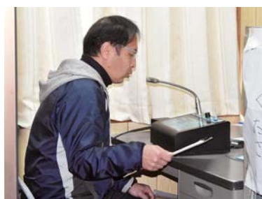
◀3月6日、笠野原小学校の教員が、町内放送等を使って臨時休業期間中で自宅にいる子どもたちを励ますための放送を行いました。これは学校からの相談に笠之原町内会が協力し行われたものでした。