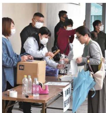
▲3月22日、寿小学校で、その児童がいる家庭への消毒液(次亜塩素酸)の無料配布が行われました。これは市中での消毒液の不足を受け、同校PTAが何かできないかと企画し実施したものでした。