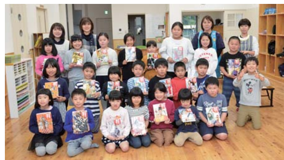
▲3月14日、地域活性化に取り組む団体「上小原ふるさとの会」が、上小原児童クラブに対し、給食食材費と本のプレゼントを行いました。