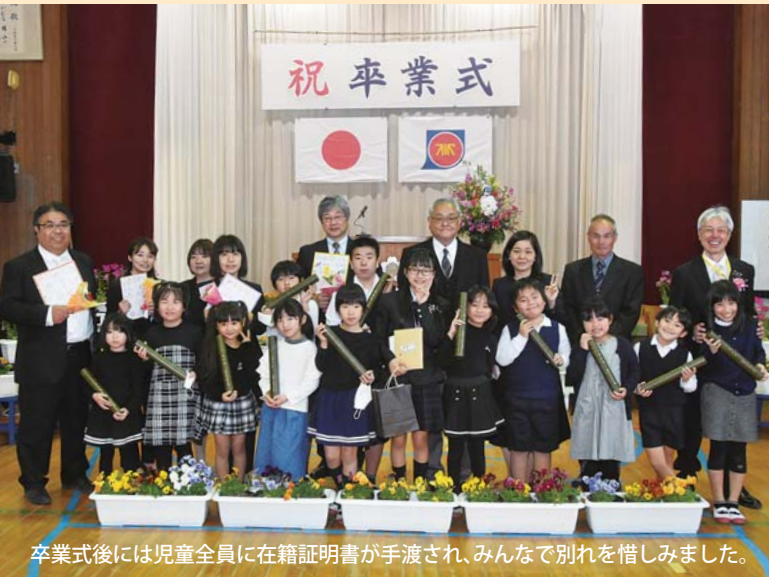
卒業式後には児童全員に在籍証明書が手渡され、みんなで別れを惜しまました。