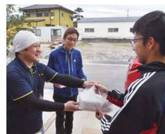
▲おおすみ弁当札元店では、学校の臨時休業期間中、鹿屋東中学校区内で子どもがいる共働き世帯・1人親世帯を対象とした昼の弁当配達サービスを始め、この取り組みに多くの企業が協力しました。