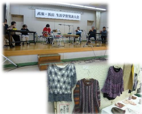
昨年の舞台発表、展示風景