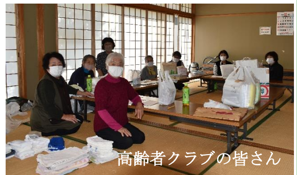
高齢者クラブの皆さん

学習センターへの配布もあり、大切に使用させていただきます。ありがとうございました。