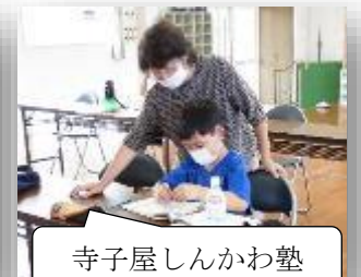
寺子屋しんかわ塾