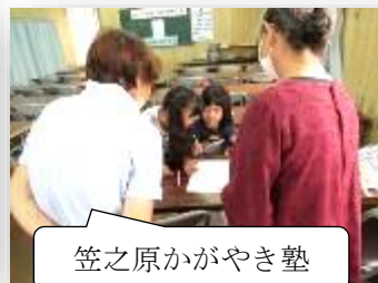
笠之原かがやき塾